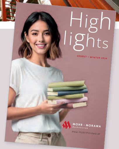
NEU! Highlight Kataloag 2024

Stolz können wir heute sagen, dass wir innerhalb der letzten 8 Jahre unseren Umsatz beinahe verdoppeln konnten. Das gelingt natürlich nur mit der Unterstützung ausgezeichneter Mitarbeiter:innen und zufriedenen Partnern aus der Verlags- und Bucheinzelhandelsbranche.